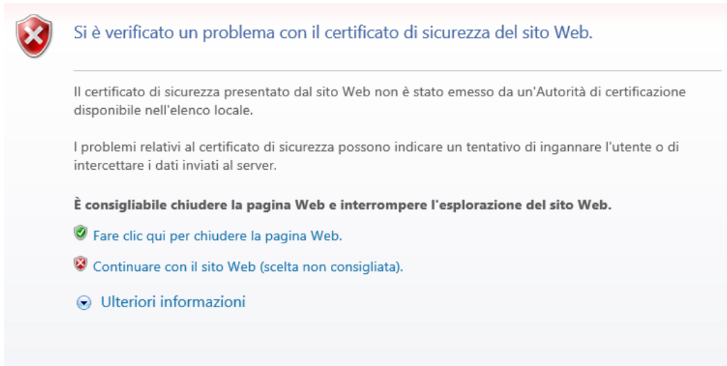
Figura 3 - Internet Explorer: Connessione non privata

Davanti alla schermata riportata in Figura 3, procedere selezionando “Continuare con il sito Web (scelta non consigliata).”